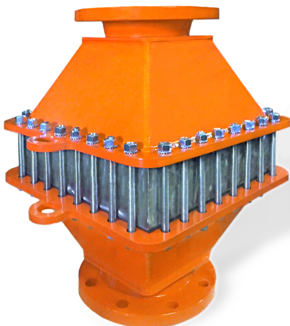
DRUCKVERLUSTTABELLE DER DETONATIONS - ROHR SICHERUNG DAG-A7-B-IIA-150