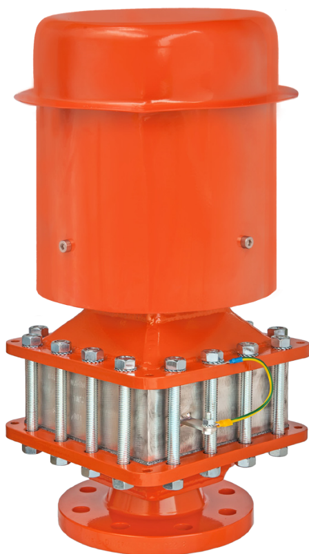
TLAKOVÁ ZTRÁTA PROTIEXPLOZNÍ POJISTKY