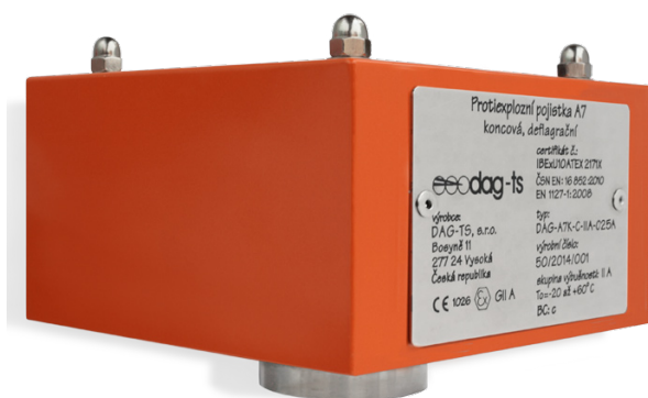
TLAKOVÁ ZTRÁTA PROTIEXPLOZNÍ POJISTKY